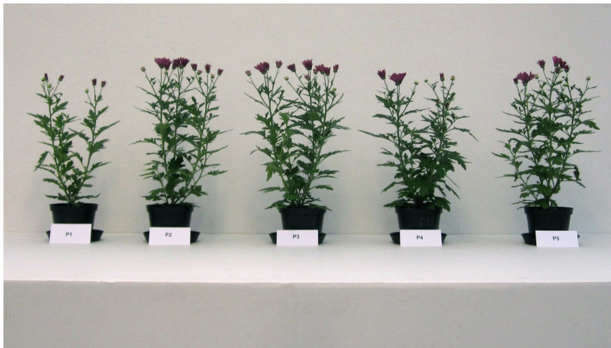
Bild 2: Hos krysantemum avvek endast den lägsta fosforgivan tydligt.

EDR-lera påverkade inte resultatet för krysantemum.